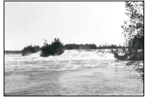
Les chutes Mohr et Horseshoe avant la construction des barrages des Chats

Amis, a ensuite parlé d'une première phase (sur trois ans) d'aménagement et de mise en valeur du territoire. Cette proposition inclut la réalisation de sentiers et d'infrastructures connexes, une étude de faisabilité sur l'utilisation de l'ancien pont ferroviaire et un plan d'architecte pour l'aménagement d'un centre des visiteurs (probablement situé dans le moulin de Quyon). (suite à la page suivante)