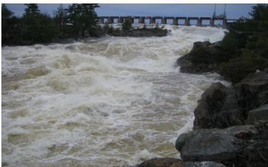
Les rapides des Chats à Merrill écluse

Le 9 août 2017, les Amis du Sault-des-Chats sont devenu réalité! Un premier conseil d'administration a été élu (voir le résumé). Nous travaillons activement à la réalisation de la mission et des objectifs que s'est donné cet organisme qui compte actuellement 50 membres actifs.