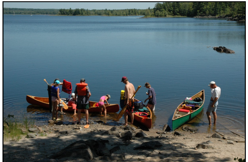
Préparation en vue d'un portage le long du canal des Chats

Information (Barbara Haughton): baiehaughton@rogers.com